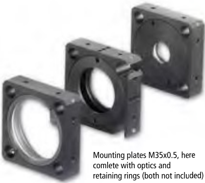
Mounting plates M35x0.5, here complete with optics and retaining rings (both not included)